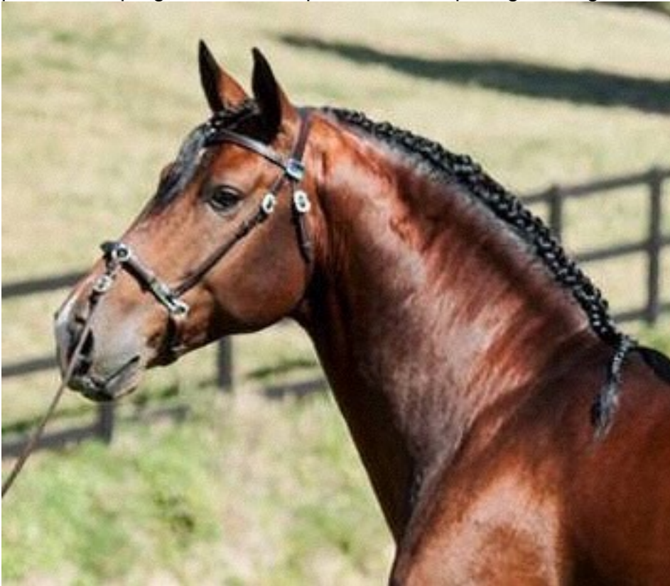
Foto presa dal Web come esempio di Toelettaura ed imbrigliamento

può essere programmata una presentazione per ogni categoria, distinta per età e sesso.