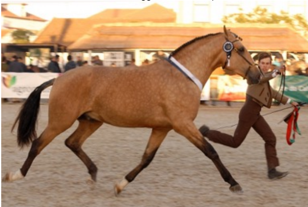
Foto presa dal web per esempio di conduzione alla mano in Performance Test

Non devono essere considerati positivamente cavalli in uno stato di agitazione/ eccitazione che manifestano atteggiamenti da “capo-branco.