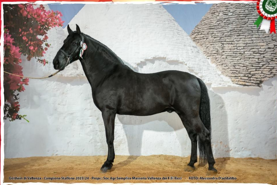
Goldwin di Vallenza - Campione Stallone 2023/24 - Propr.: Soc. Agr. Semplice Masseria Vallenza dei F.lli Ricci

17ª MOSTRA NAZIONALE DEL CAVALLO MURGESE E ASINO DI MARTINA FRANCA